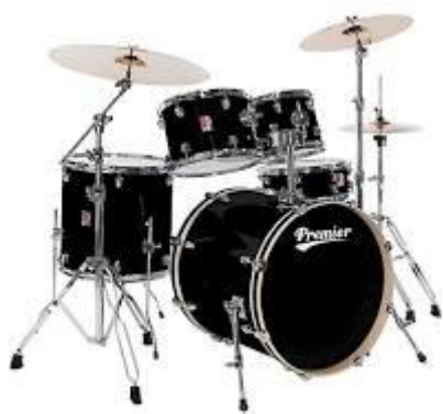
to perkusja i pianino

Super pierwsze to skrzypce a drugi to flet .Na skrzypcach gramy przeciągając smyczkiem po strunach a na flecie dmuchając w niego. A oto jeszcze inne instrumenty;