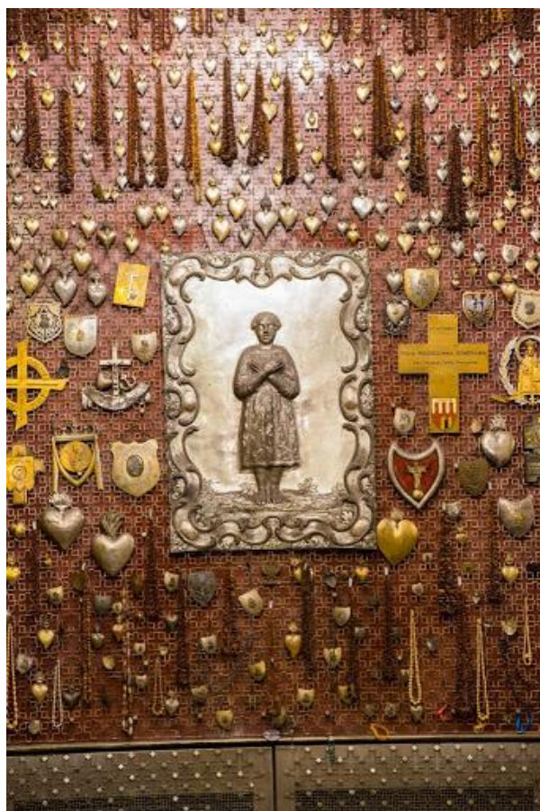
Wotum papieskie, przestrzelony pas (po lewej stronie).